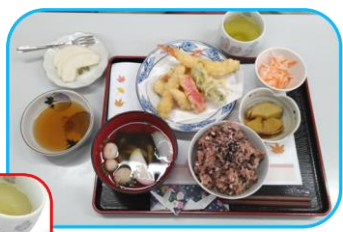
祝い膳 鈴カステラの紅白カメとミニたい焼き