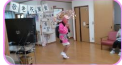
ボランティアさんの傘踊り