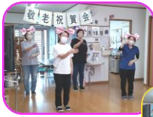
ふるさとの歌と手話