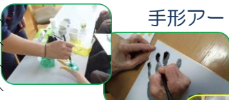
記念品作り 手形アート